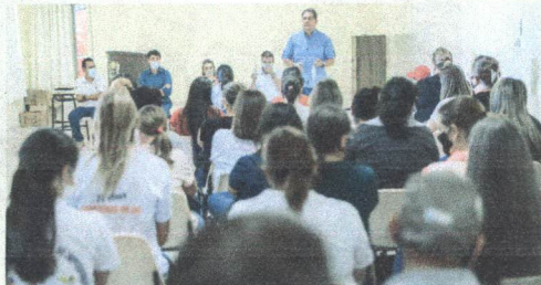
Entrega dos Tablets para os Agentes Comunitários de Saúde e Agentes de Endemias Novembro/2021