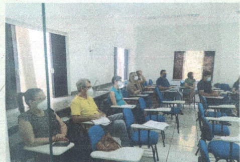
Capacitação dos médicos das ESF pelo psiquiatra