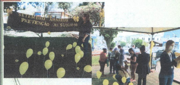
Setembro Amarelo Campanha de Prevenção ao suicídio