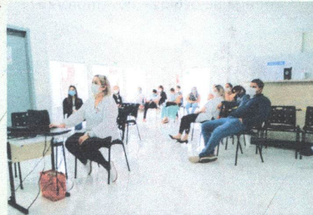
Matriciamento de ESF pelo CAPS - Celeste