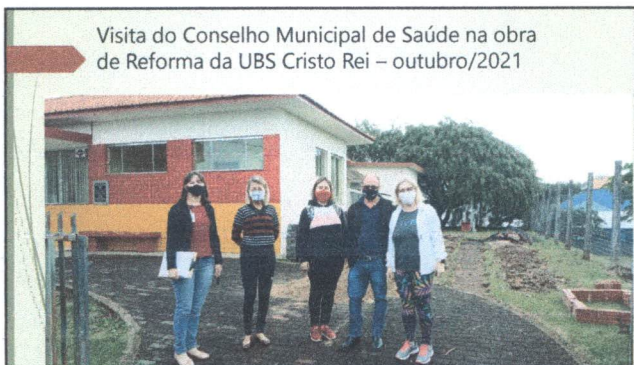
Visita do Conselho Municipal de Saúde na obra de Reforma da UBS Cristo Rei – outubro/2021