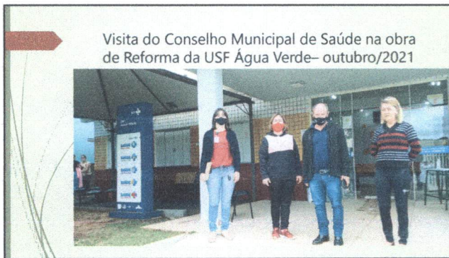
Visita do Conselho Municipal de Saúde na obra de Reforma da USF Água Verde – outubro/2021